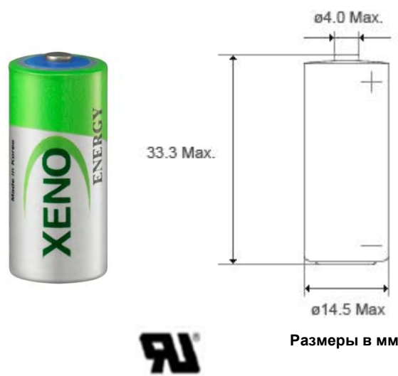
Размеры в мм

Способности Максимального импульса показывающий более 3,0 В на 90mA (0.1sec. каждые 2 мин. при 20 °C, 10 μA / см² ток базы с новыми батареями). Способность импульса может отличаться от статуса батареи и окружающей среды. Для восстановления максимального импульса, рекомендуется поддержка конденсатора.